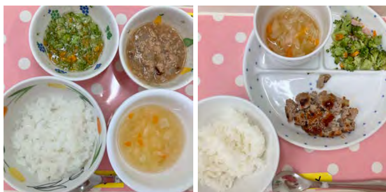
(左)離乳食中期、 (右)0歳児の給食例

毎月の給食は専任栄養士が献立を作成し、主食、副食、おやつ栄養面を考え、自園調理を行っています。入園時、進級時に食材チェック表を配布し、お子様の苦手なものを把握し、偏食をなくすために、ご家庭と連携を取りながら、無理なく進めていきます。毎日の献立(いままで提供した給食写真)、その日の食べ具合はコドモンからご確認ください。