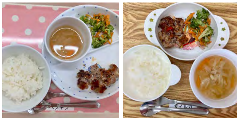
(左)1歳児 (右)2歳児の給食例

保育園の給食は、園児の心身の成長発達と健康保持増進に必要な栄養を与えると共に、給食をとおして望ましい食生活を身につけることを目的としています。